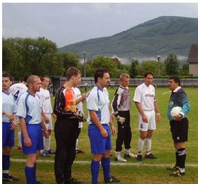
Zo zápasu s Lipovníkom

Okrem toho si pamätám zápas s Krh. D. Lúkou 4:2, hostia vyrovnali, ale domáci dvoma gólmi zvrátili stav.