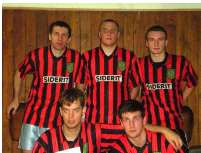
Z halového turnaja, chýba Cangár