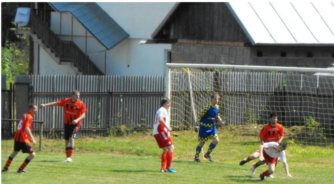
Z turnaja vo Vyšnej Slanej