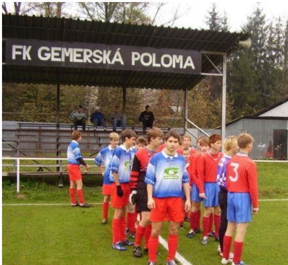
Zo zápasu s Dedinkami