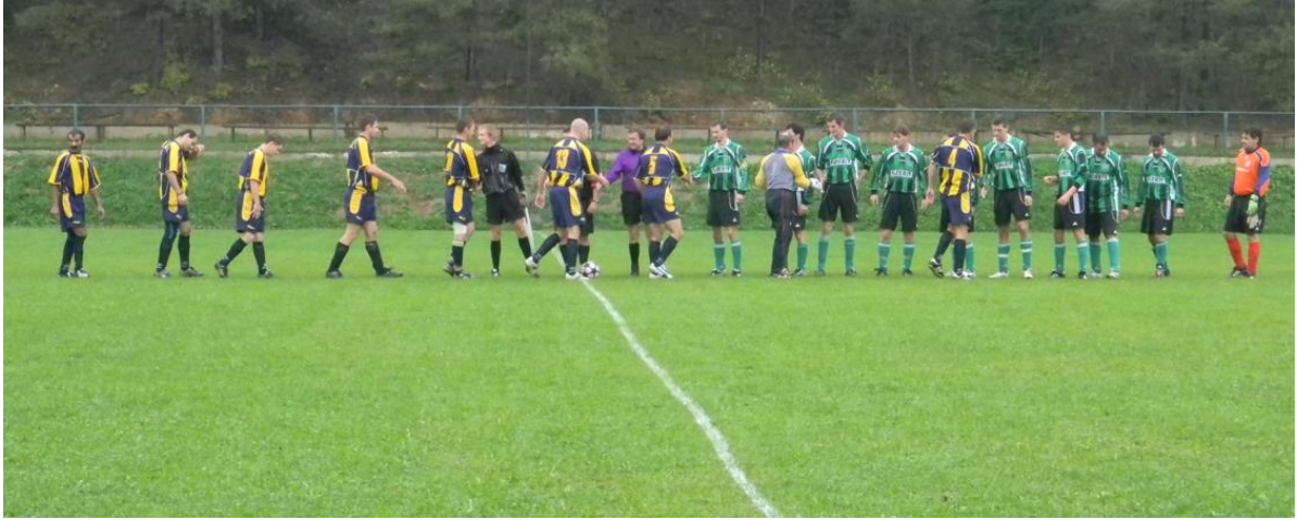
Zo zápasu s Rožňavským Bystrým