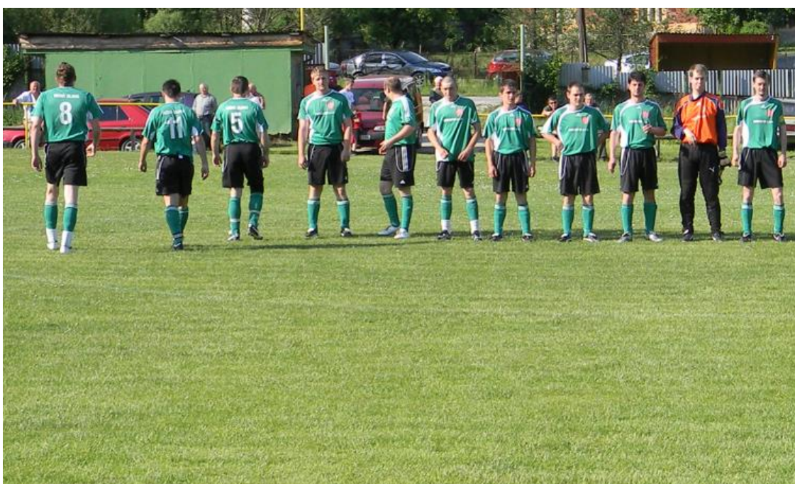
Zo zápasu v Rožňavskom Bystrom