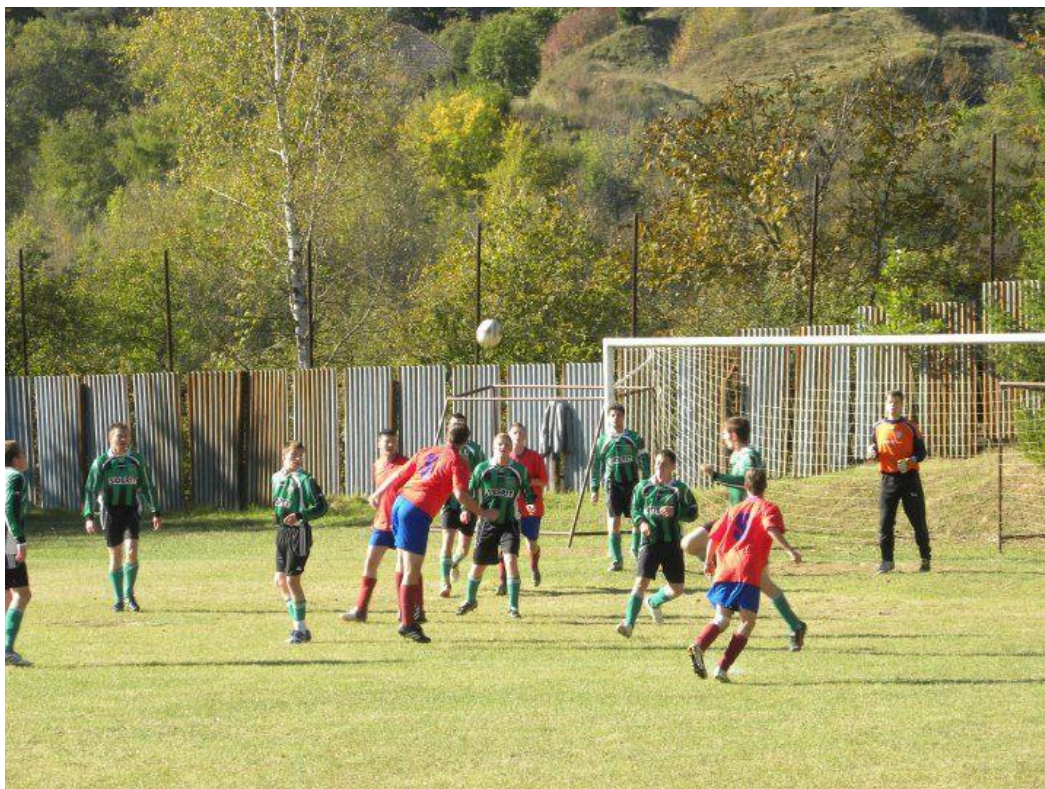
Zo zápasu s Dedinkami