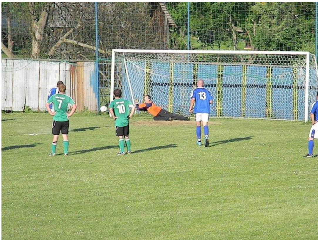
Vyrážam penaltu Jána Urbana