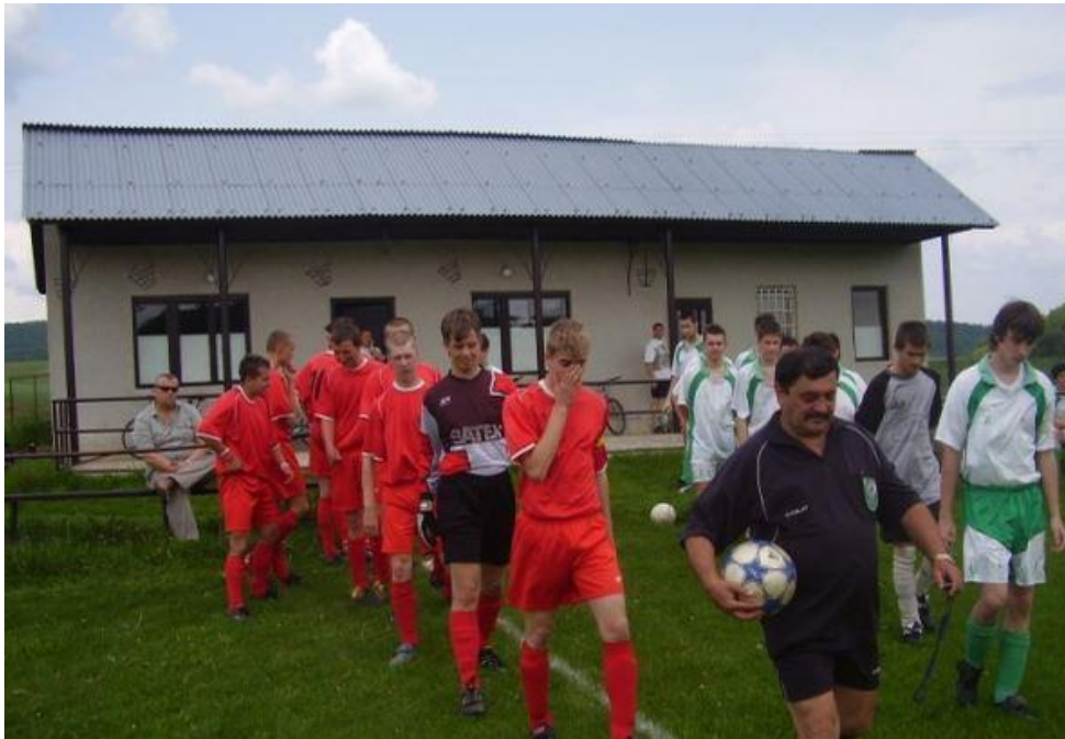
Zo zápasu v Dlhej Vsi, veľa práce som nemal