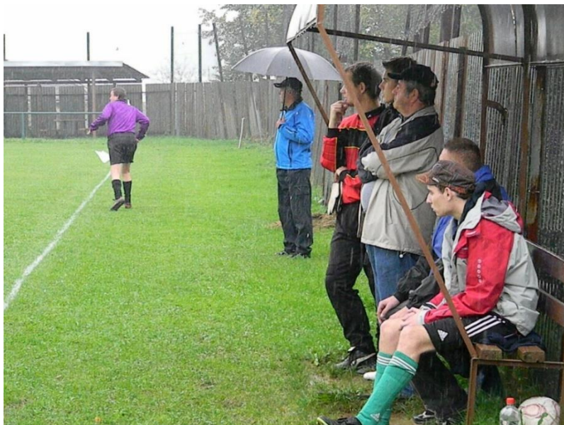
Zo zápasu s Rožňavským Bystrým

Na Pači som chytal, ale prišli sme v slabom zložení, iné ako prehra sa čakať nedalo. Doma s Dedinkami chytal Krnáč, ale prehrali sme 1:2. Na moje narodeniny sme v Čoltove prehrali, zápas sa nedohral, nebol som ani oblečený do dresu.