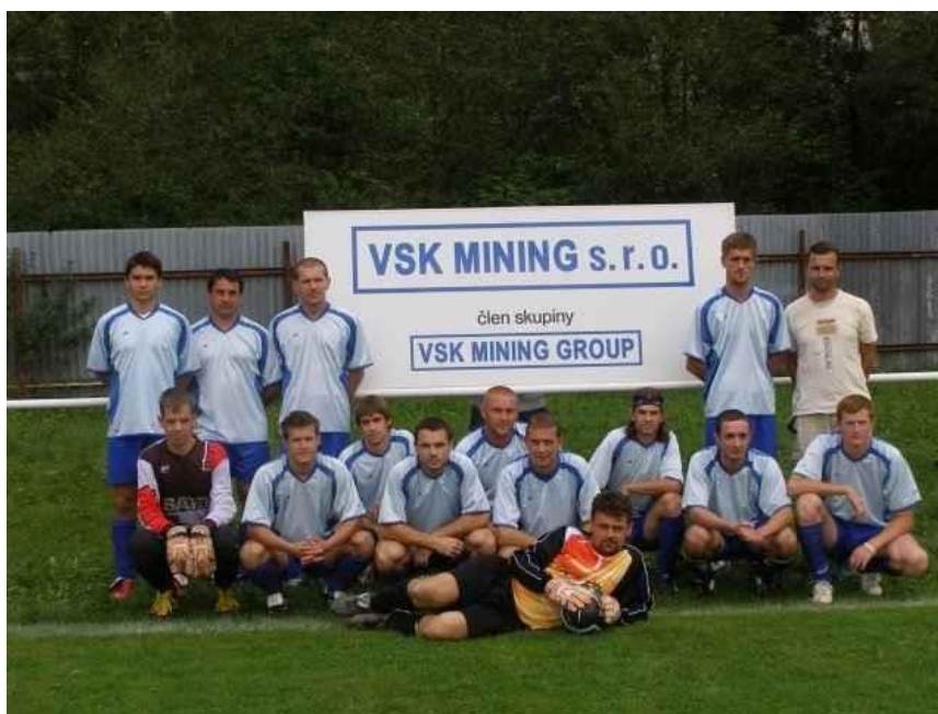
Mužstvo Gemerskej Polomy na jeseň 2007

Celú jesennú časť som neodohral ani minútu. V jarnej príprave som chytal celý zápas proti Nižnej Slanej a celý proti Honciam. Potom som chytal aj 10 minút v prípravnom zápase Vlachovo – Rožňavské Bystré. Nastúpil som za hostí. Po prehranom zápase v Plešivci som prestal chodiť na zápasy.