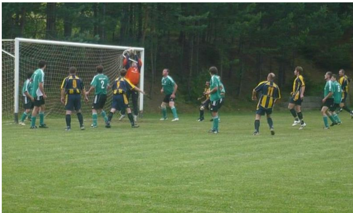
Zo zápasu s Rožňavským Bystrým

Odchytal som zápasy s Rakovnicou, Kovstavom, Rožňavským Bystrým, Pačou, Kružnou a Ml. Brzotínom. V kategórii dospelí to považujem za najúspešnejšie obdobie. Účasť na tréningoch bola dobrá. Veľmi korektné považujem aj preplatenie nákladov za chrániče.